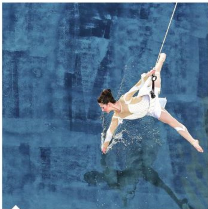
El arte se vivió en todos los rincones de la sede